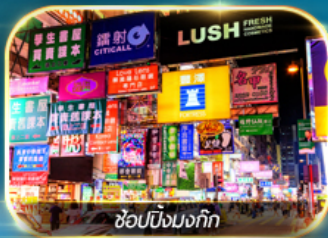
ช้อปปิ้งมงก๊ก

เต็มอิ่มทั้งบุญ และ ช้อปปิ้งแบบจัดเต็ม จิมซาจู้ย มงก๊ก