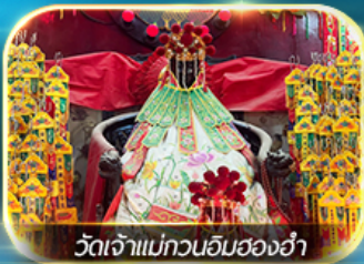
วัดเจ้าแม่ทวนอิมของอ่ำ