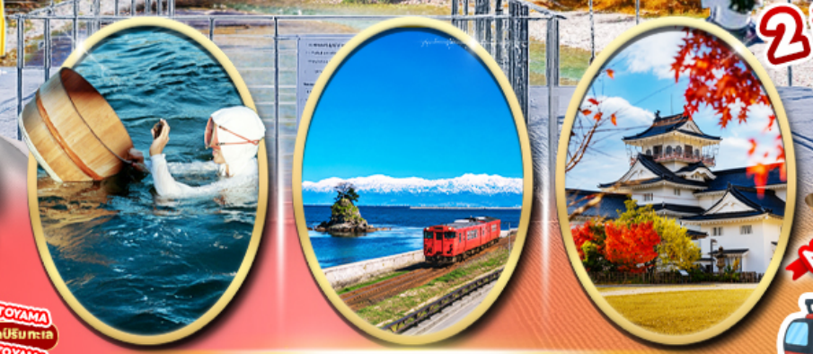
Mikimoto Pearl Island Amaharashi Coast Toyama Castle

Starbucks Kansui Park จุดถ่ายรูป Amazing Toyama ช้อปปิ้งผ่านซากาเอะ