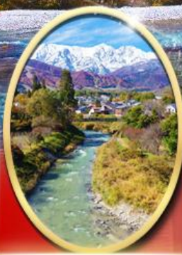
โออิเดะพาร์ค