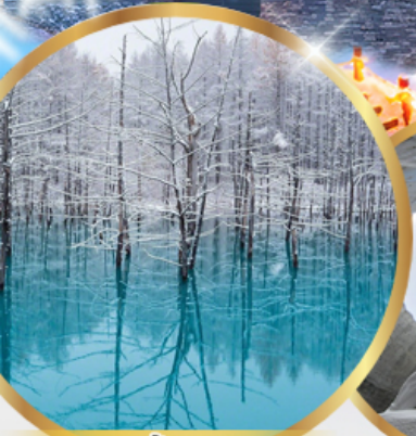
บ่อน้ำสีฟ้า