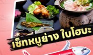
เช็กหญ่ย่าง ใบโอบะ