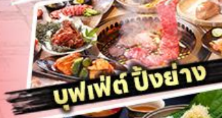
บุฟเฟต์ บิงย่าง