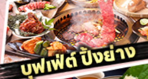
บุฟเฟต์ ปิ้งย่าง