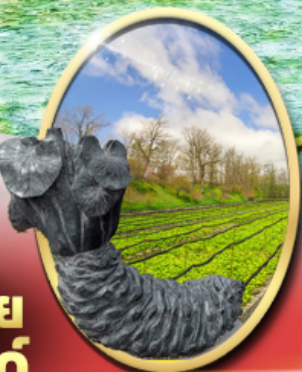
ฟาร์ม วาซาบิ ไดโอะ