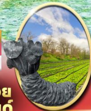
ฟาร์ม วาซาบิ ไดโอะ

รหัสทัวร์ RJ-XJ121 เดินทาง 6D 4N เมษายน - มิถุนายน 69