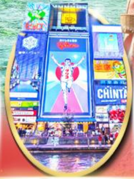
ซ็อบบิง ซินโซบาชิ