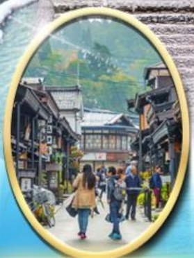
เมืองเก่า ทาคายามา