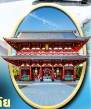
วัด เซ็นโซจิ