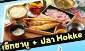
เซ็ทซาบู + ปลา Hokke