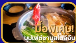
มีอาหารพิเศษ! บุปเฟ่ต์ชาบูสไตล์จีน