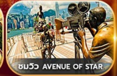
ชมวิว AVENUE OF STAR