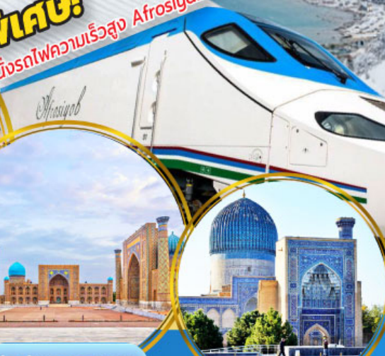
จัตุรัสเรจิสถาน