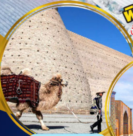
บ้อมปราการบุการ์่า