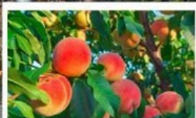
เก็บลูกพีชสด ๆ จากต้น