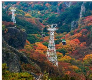
นั่งกระเช้าชมเขา ดังคาเดอิ