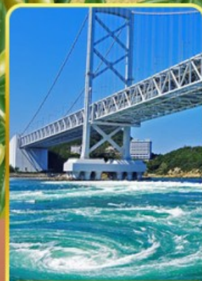
ช่องแคบนารุโตะ