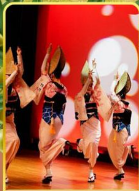
อะวะ โอะโตะริ โคคัง