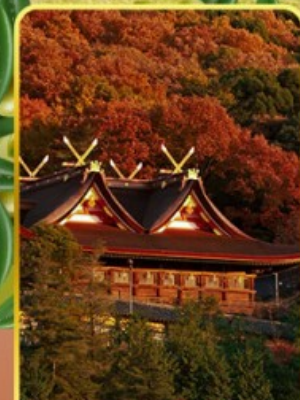
ศาลเจ้าคิบิฮิโกะ