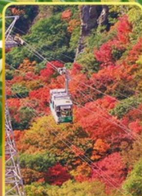
กระเช้าหุบเขาคังคาเคอิ