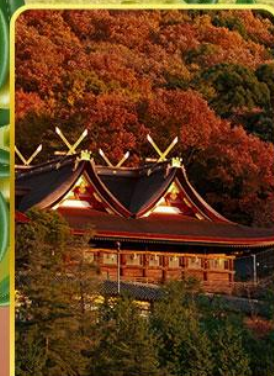
ศาลเจ้าคิมิฮิโกะ