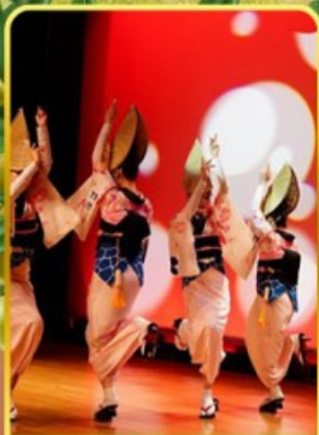
อะวะ โอะโตะริ โคคัง