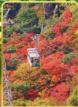
กระเช้าหุบเขาคังคาเคอิ