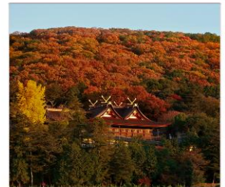
ศาลเจ้าคินิชิอิโกะ