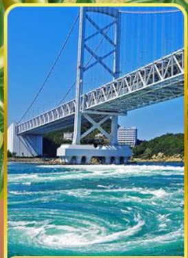
ช่องแคบนารุโตะ