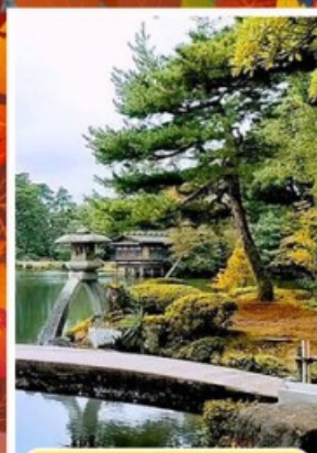
สวนเคนโระคุเอ็น

🌫️ ออนเซ็น 3 คั้น 🧳 นน.กระเป๋า 23 กก. ☀️ 7Days 5Night