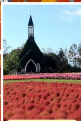
สวนบกกะโนะซาโตะ