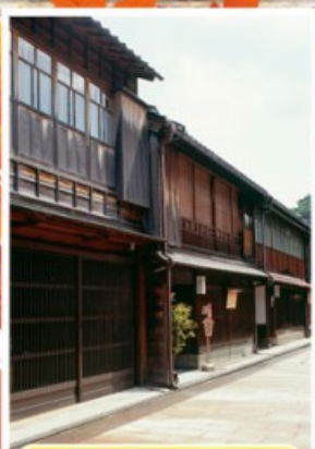
ย่านอิงาชิบายะ