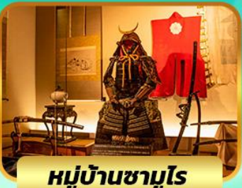
หมู่บ้านซามูไร