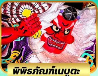
พิพิธภัณฑ์เมบูตะ