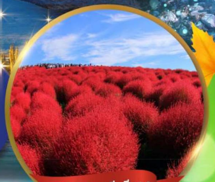
ทุ่งดอกโคเคียสีแดง

ชมใบไม้เปลี่ยนสีที่ คามิโคจิ • ทุ่งดอกโคเคีย ณ สวนชิตาชิไซด์ • ศาลเจ้าโอะอาไร ฟูจิชั้น 5 • พิธีชงชา • หมู่บ้านโอะชิโนะฮักโก • ปราสาทมัตสึโมโด้ (ชมด้านนอก) โอดะวะ กันดั้ม • ซุปป์ชินจูกุ • อิสระเต็มวัน เที่ยววัดสมัย หรือ ซุปป์ตามอริยาตัย