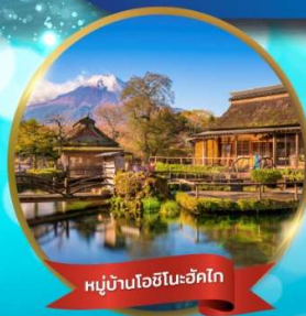
หมู่บ้านโอยิโนะฮักโก