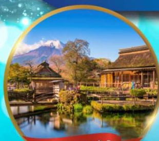
หมู่บ้านโอะชิโนะฮักโก