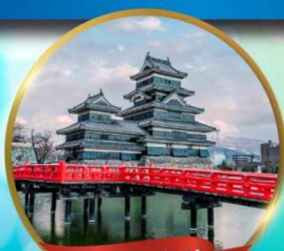
ปราสาทมัตสึโมโด้