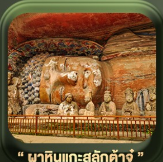
“ พาคินแกะสลักต้าจู้ ”

วันเดินทาง มี.ค. - ต.ค. 2569 ราคาเริ่มต้น 22,999.-