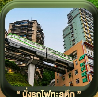
“ นั้งรถไฟทะเลตึก ”

บินตรงลงจงชิ่ง • อุ้หลง หลุมฟ้าสะพานสวรรค์ • ระเบียบแก่ว • อุทยานเขานางฟ้า หงหยาดัง • นั้งรถไฟทะเลตึก • ศาลาประชาคม (ด้านนอก) • หลงหมินฮ่าว มรดกโลกพาคินแกะสลักต้าจู้ • วัดหลัวฮั่น • ตึกตะเกียบ • ถนนคนเดินเจียฟางเป่ย์