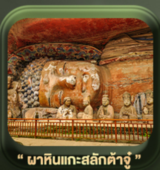
“ ฟาหิ้นแกะสลักต้าจู้ ”