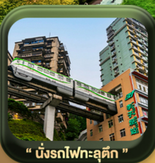
“ นั้งรถไฟทะลุคิก ”

บินตรงลงจงซิ่ง • อุ๋หลง หลุมฟ้าสะพานสวรรค์ • ระเบียบแก่ว • อุทยานเขานางฟ้า หงหยาดัง • นั้งรถไฟทะลุคิก • ศาลาประชาคม (ด้านนอก) • หลงหมินฮ่าว มรดกโลกฟาหิ้นแกะสลักต้าจู้ • วัดหลัวฮั่น • ตึกตะเกียบ • ถนนคนเดินเจียฟางเป่ย์