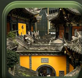
“ วัดหลิวอัน ”