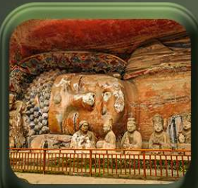
“ ผาหินแกะสลักต้าจู้ ”