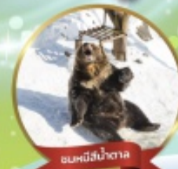
ฟาร์มหมีสึน้ำตาล