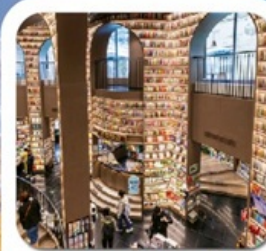
"ห้างสรรพสินค้า จงซูเก๋อ"