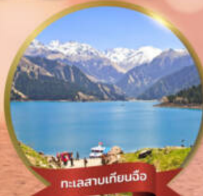
ทะเลสาบเทียนจื่อ