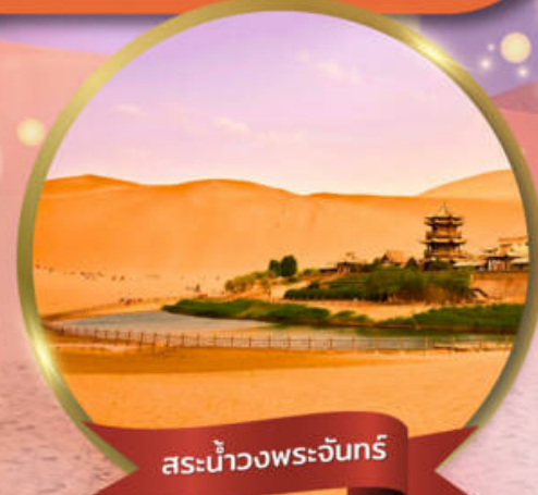
สระน้ำวงพระจันทร์