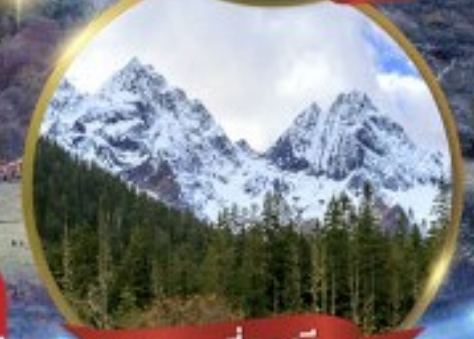
ภูเขาสี่ฤดู