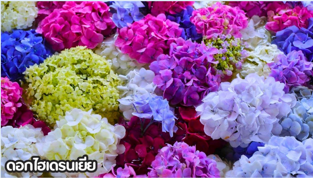
ดอกไฮเดรนเยีย

(ปลายเดือนพฤษภาคม-มิถุนายน): ชมดอกไม้ไฮเดรนเยีย ดอกไฮเดรนเยียที่คุนหมิง ประเทศจีน บานสะพรั่งสวยงามที่สุดในช่วงเดือนมิถุนายน โดยเฉพาะบริเวณทุ่งไฮเดรนเยีย (The Middle Sea Hydrangea Kunming) ซึ่งมีหลากหลายสีทั้งฟ้า ชมพู และม่วง เป็นจุดถ่ายรูปยอดนิยมที่ห้ามพลาด เนื่องจากอากาศที่เย็นสบายและทิวทัศน์ที่งดงาม