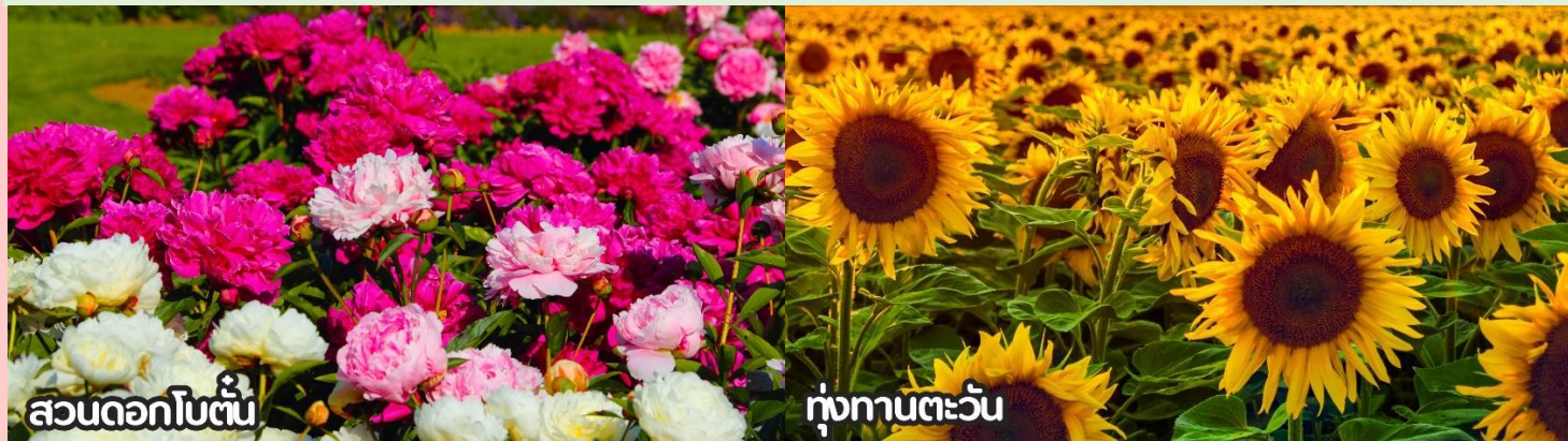
สวนดอกโบตั๋น

เดือนสิงหาคม-ต้นกันยายน ชมทุ่งดอกเบญจมาศหรือดอกไฮเดรนเยีย ดอกเบญจมาศปักกิ่งหมายถึงสายพันธุ์เบญจมาศที่มีต้นกำเนิดหรือนิยมปลูกในกรุงปักกิ่ง ประเทศจีน โดยเฉพาะช่วงฤดูใบไม้ร่วง ที่มีการจัดงานมหกรรมดอกเบญจมาศ แสดงความหลากหลายของสีส้มและรูปทรง มีสายพันธุ์เช่น "กุสุยจินเสีย" ที่ได้รับรางวัลราชาดอกเบญจมาศ และยังมีเบญจมาศปักกิ่งสีขาวที่เป็นสมุนไพรด้วย ที่สำคัญคือเป็นดอกไม้ที่ใช้ในงานเทศกาลและวัฒนธรรม โดยเฉพาะในสวนสาธารณะ เช่น รือถาน และอุทยานเป่ย์ไห่ มีหลากหลายสี เช่น ขาว เหลือง ชมพู แดง และม่วง สามารถพบได้ในหลายพื้นที่