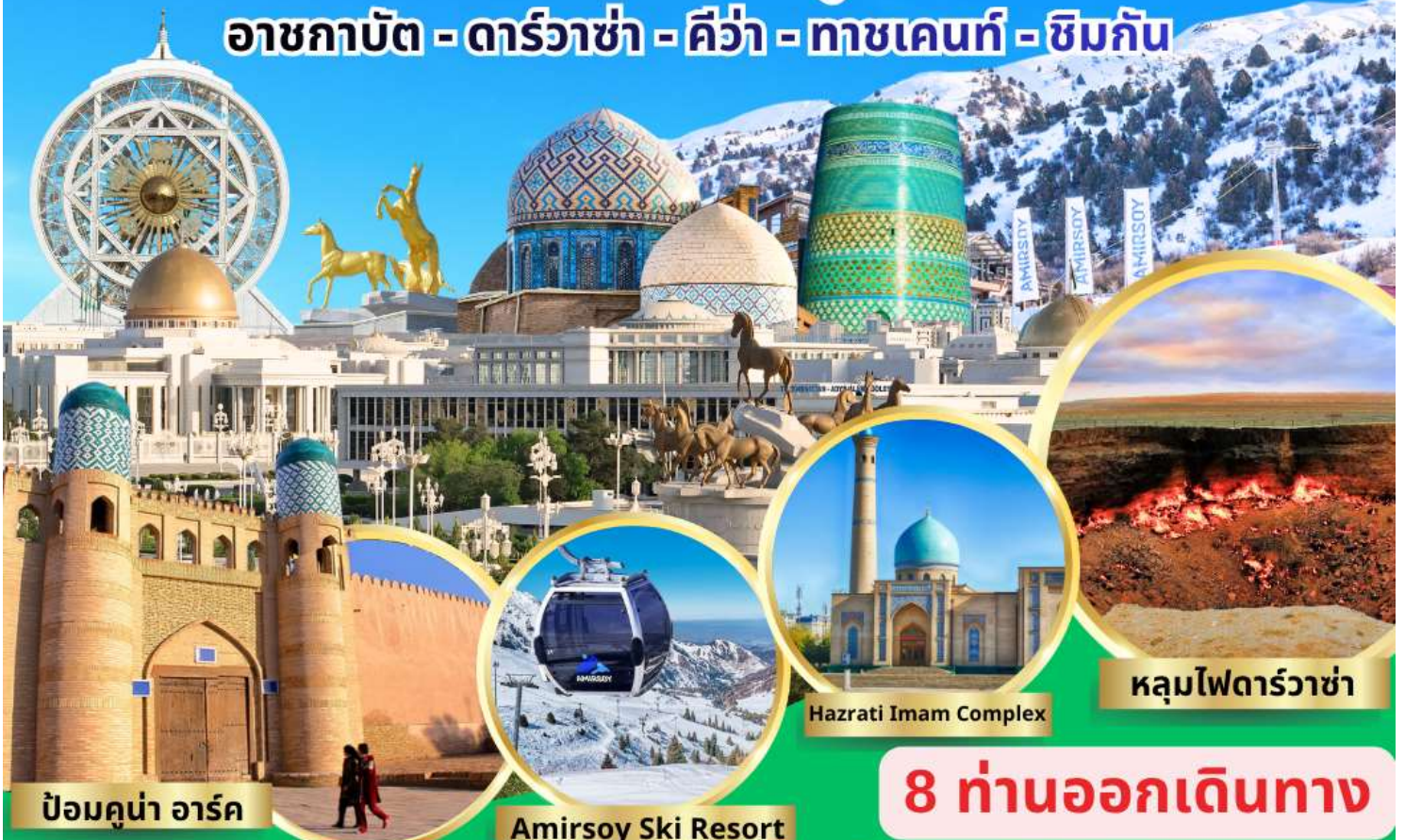
ป้อมคูน่า อาร์ค

อาชกาบัต - ดาร์วาซ่า - คีว่า - ทาชเคนท์ - ซิมกัน