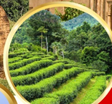
ไร่ชาอัสสัม