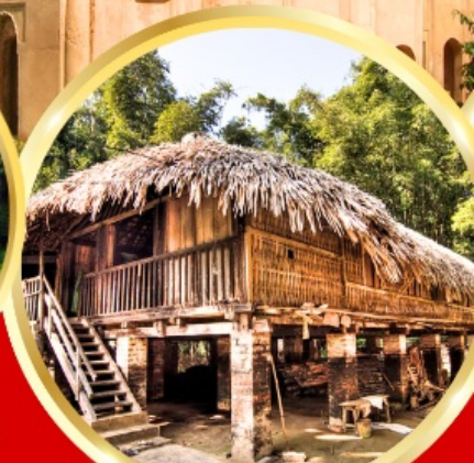
หมู่บ้านไทผาเก