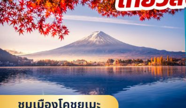
ชมเมืองโคชูยูเมะ