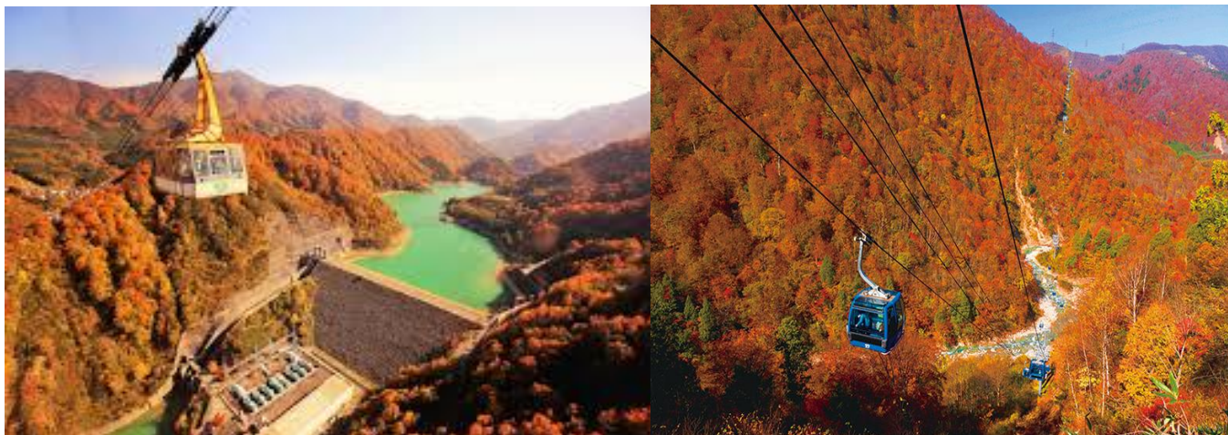
ของบริเวณโดยรอบ

Yuzawa Kogen Ropeway เป็นกระเช้าลอยฟ้าขนาดใหญ่ระดับโลกที่รองรับได้ถึง 166 คน ใช้เวลาเดินทางเพียง 7 นาทีบนเส้นทางราว 1,300 เมตรเชื่อมต่อระหว่างตีนเขากับ Panorama Park ที่อยู่เหนือระดับน้ำทะเลกว่า 1,000 เมตร หน้าสถานีพานอรามาบนยอดเขานั้นเป็นบริเวณที่มีบ่อแช่เท้าและระเบียงกลางแจ้ง ทั้งยังเชื่อมต่อกับ Kumono Ue Cafe คาเฟ่ที่สามารถผ่อนคลายได้อย่างสบายๆ พลาชมวิวดูจุดสังเกตการของที่ราบ Uonuma และเทือกเขา Tanigawa ที่แผ่กว้างอยู่เบื้องหน้า Panorama Park เป็นบริเวณที่มีการแบ่งออกเป็นหลายโซน สามารถเพลิดเพลินไปกับกิจกรรมที่หลากหลาย เช่น การโหนซิปไลน์หรือการเดินป่าพลาชมทิวทัศน์สุดอลังการ