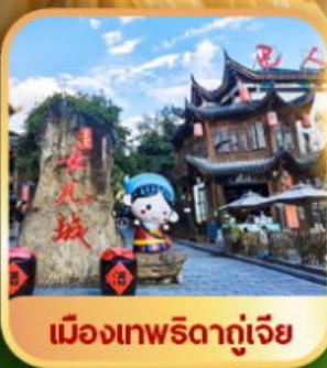
เมืองเทพริดาตุ๋เจีย