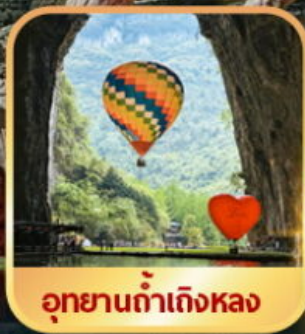
อุทยานถ้ำถึงหลง