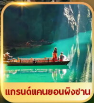
แกรนด์แคนยอนผิงชาน