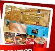
ก๊วยแม่น้ำ + HOTPOT SEAFOOD