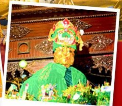
ขอพรแม่ยักย์