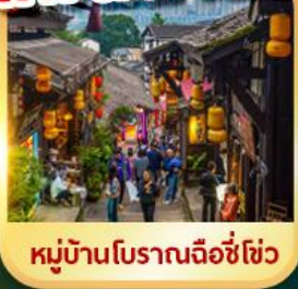
หมู่บ้านโบราณเฉิงชู่ชิว