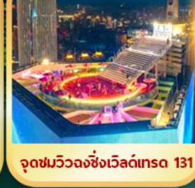
จุดชมวิวจางชิ่งเวิลด์เทรด 131