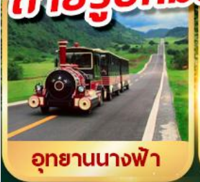
อุทยานนางฟ้า