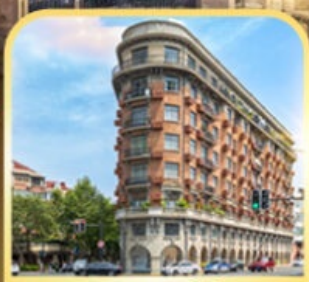
อาคารอู่คัง