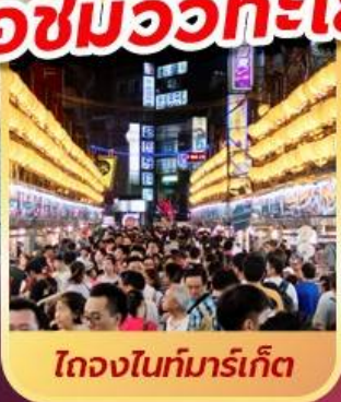
ท้องถนนที่มาร์เก็ต