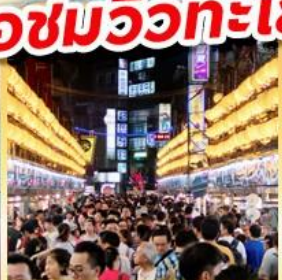
โด่งไนท์มาร์เก็ต