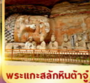
พระแกะสลักหินต้าจู๋