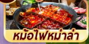
หม้อไฟหม่าล่า