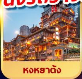
หงหย้าต้ง

บินตรงเชียงใหม่ลงชิง นั่งรถรางชมวิวอุทยานนางฟ้า