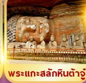
พระแกะสลักหินต้าจู๋