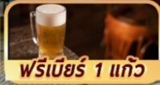
ฟรีเบียร์ 1 แก้ว