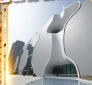
โรงละครโดง