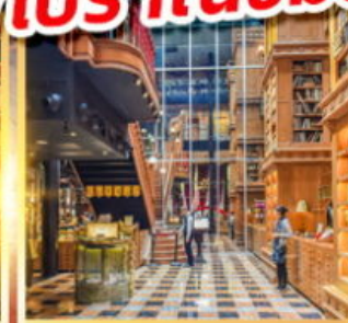
ร้านไอศกรีมมียาฮาร์