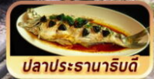
ปลาประจานาริบดี