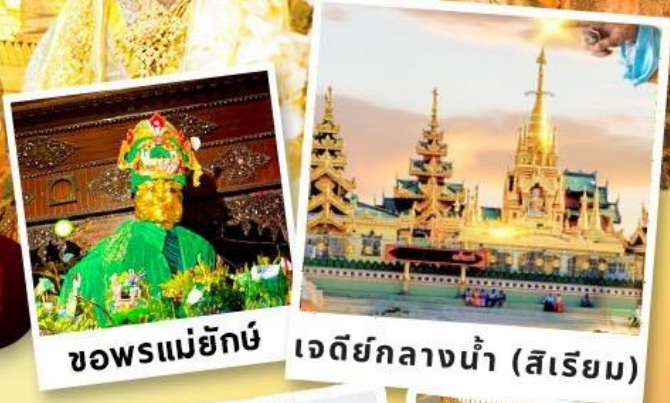
ขอพรแม่ย่ากัณฑ์ เจดีย์กลางน้ำ (สิริเยม)