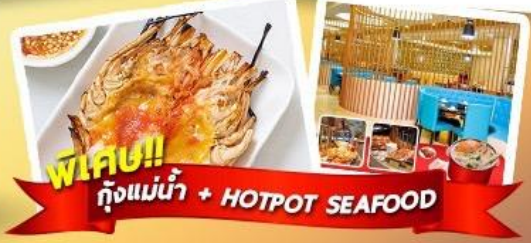
พิเศษ!! ก๊วยแม่น้ำ + HOTPOT SEAFOOD