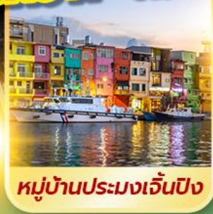
หมู่บ้านประมงเจินปิง