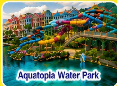
Aquatopia Water Park