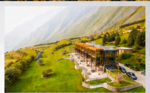
THE ROOM KAZBEGI HOTEL