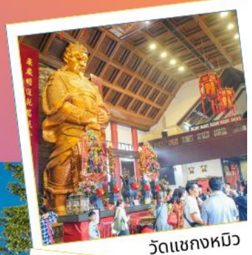
วัดแชกงหมิว