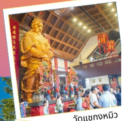
วัดแชกงหมิว