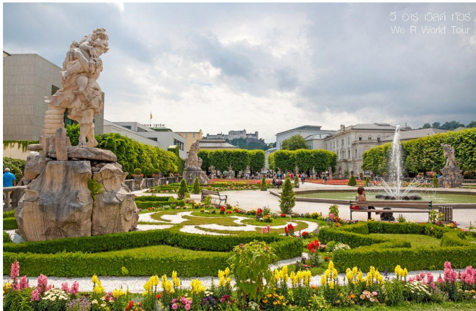
3 018 15141 1015 We R World Tour

สร้างขึ้นตั้งแต่ปี ค.ศ. 774 ถือเป็นโบสถ์บาโรกยุคแรก ถูกสร้างขึ้นใหม่แทนโบสถ์หลังเดิมที่ถูกไฟไหม้จนเกินซ่อมแซม มหาวิหารแห่งนี้ถูกบูรณะใหม่อีกครั้งหลังจากถูกระเบิดในสมัยสงครามโลกครั้งที่ 2 นำท่านชม สวนมิราเบลล์ (MIRABELL GARDEN) สวนสาธารณะสไตล์บาโรกที่สวยงามที่สุดในเมือง เดิมเป็นสวนของพระราชวังมิราเบลล์ (MIRABELL PALACE) ซึ่งพระราชวังแห่งนี้ก็เป็นหนึ่งในสถานที่ที่โมซาร์ทเคยมาจัดการแสดง และยังเป็นสถานที่ถ่ายทำภาพยนตร์เรื่อง The Sound of Music อีกด้วย นำท่านแวะถ่ายภาพเป็นที่ระลึก ณ บ้านเกิดโมซาร์ท (MOZART'S BIRTHPLACE) อาคารสี่เหลี่ยมหมายเลข 9 ซึ่งเป็นสถานที่เกิดและเติบโตของคีตกวีเอกของโลกร่วม 20 ปี จากนั้นนำท่านถ่ายรูปกับ ป้อมปราการโฮเฮนซาลซ์บวร์ค (HOHENSALZBURG) เป็นปราสาทแห่งยุคกลางอายุกว่า 500 ปีที่ใหญ่และสภาพสมบูรณ์ที่สุดในยุโรป