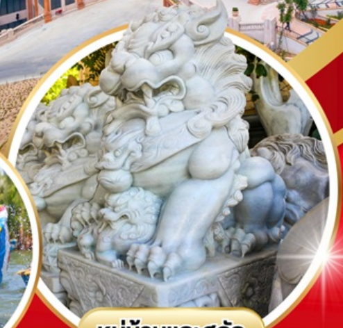
หมู่บ้านแกะสลัก