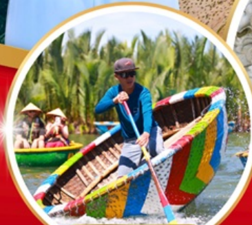
เรือกระด้าง