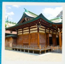
Imamiya Ebisu Shrine