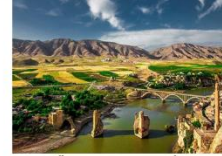
เมืองฮาซานคีฟ

** พักที่ Kardelen Hotel 4* หรือเทียบเท่า **