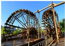
สวนกังหันวิดน้ำโบราณ

08.25 น. ออกเดินทางสู่เมืองหลานโจว เที่ยวบิน CZ8985 11.35 น. เดินทางถึงสนามบินหลานโจวจงชาน