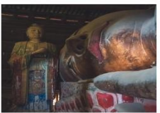
วัดพระใหญ่จางเย่