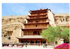
ถ้ำม่อเกาคู