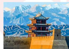
กำแพงเมืองด่านเจียอี้กวน

** พักที่ Cheng Feng Hotel 4* หรือเทียบเท่า **