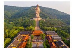
เทือกเขาเทียนชาน ร่องเรือทะเลสาบเทียนฉือ วัดพระใหญ่หรงกวงชาน

** พักที่ Mercure Wanda Hotel 4* หรือเทียบเท่า **