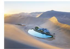
ทะเลทรายหมิงซาซาน ทะเลสาบพระจันทร์เสี้ยว

16.32 น. ออกเดินทางสู่เมืองอู๋หลู่ฟาน ด้วยรถไฟความเร็วสูง ขบวนที่ D55