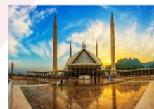
มัสยิดไฟซาล

DAY8 ตึกศิลา-พิพิธภัณฑ์ตึกศิลา-อิสลามาบัด- มัสยิดไฟซาล-Shopping-กรุงเทพฯ