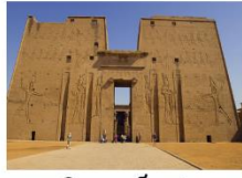
วิหารเอ็ดฟู