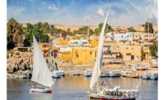
Option ล่องเรือเฟลกะ หรือ ล่องเรือชมหมู่บ้าน Nubian Village

** พักที่ Royal Beau Rivage Nile cruise 5* หรือเทียบเท่า **