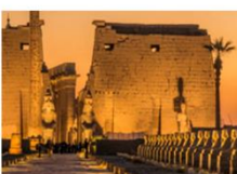
วิหารลักซอร์

** พักที่ Royal Beau Rivage Nile cruise 5* หรือเทียบเท่า **