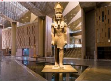
Grand Egyptian Museum

** พักที่ Movenpick Cairo Hotel 5* หรือเทียบเท่า **