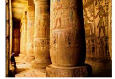
วิหารมาดินัตฮาบู

** พักที่ Royal Beau Rivage Nile cruise 5* หรือเทียบเท่า **