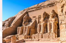
มหาวิหารอาบูซิมเบล