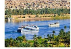
พักผ่อนตามอัธยาศัยบนเรือสำราญ

** พักที่ Royal Beau Rivage Nile cruise 5* หรือเทียบเท่า **