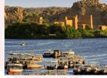
วิหารฟิเล

16.25 น. ออกเดินทางสู่กรุงไคโร สายการบิน Egypt Airlines เที่ยวบิน MS295