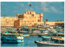
เมืองอเล็กซานเดรีย