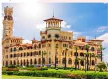
พระราชวังอัลมอนตาซาร์

** พักที่ Movenpick Cairo Hotel 5* หรือเทียบเท่า **