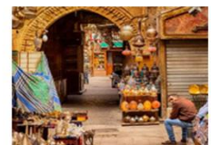
ตลาดخانเอลคาลีลี

20.50 น. ออกเดินทางสู่อิสตันบูล เที่ยวบิน TK695