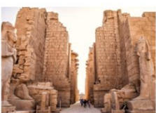
มหาวิหารคาร์นัค

xx.xx น. ออกเดินทางสู่เมืองลักซอร์ โดย Egypt Airlines เที่ยวบิน... xx.xx น. เดินทางถึงสนามบินลักซอร์