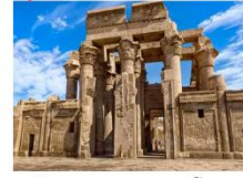
วิหารคอมมอโบ