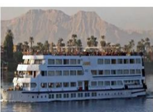
เรือสำราญแม่น้ำไนล์