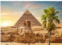
มหาพีระมิดกิซา