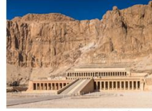
หุบผากษัตริย์