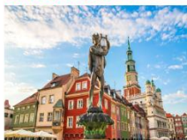
เมืองโปซัน