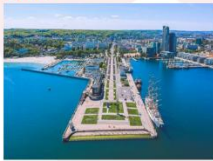
เมืองกดีเนีย