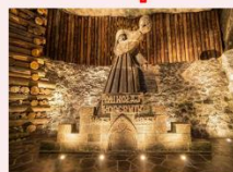
เหมืองเกลือวิลิชก้า