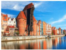
เมืองกตังส์