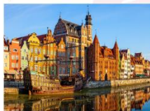
เมืองกตังส์