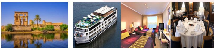
วิหารฟิเล เรือสำราญ Jaz Crown Prince Cruise 5*

07.00 น. ออกเดินทางสู่เมืองอัสวาน สายการบิน...เที่ยวบิน... 08.15 น. เดินทางถึงสนามบินอัสวาน