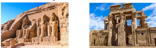
มหาวิหารอาบูซิมเบล วิหารคอมอมโบ

** พักที่ Jaz Crown Prince Cruise 5* หรือเทียบเท่า **