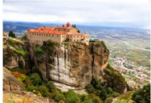
สำนักสงฆ์แห่งเมทีโอรา

** พักที่ The Stanley Hotel 4* หรือเทียบเท่า **