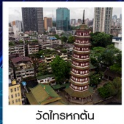
วัดโหลหุตัน

ทัวร์คุณภาพ ไม่ลงร้านช้อปปิ้ง ไม่ขายออฟชั่น